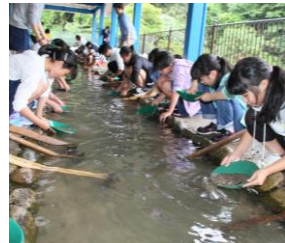
西三河で砂金取り