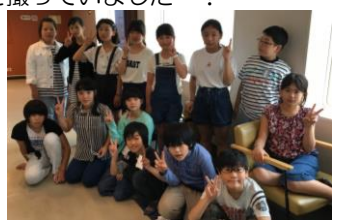
楽しい修学旅行になりました。