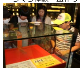
金塊の重さを体験