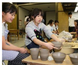
ろくろ体験・皿作り