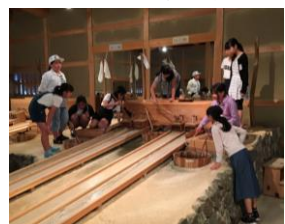
地道な作業で金を撮っていました！