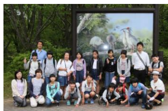
トキの森公園で集合写真